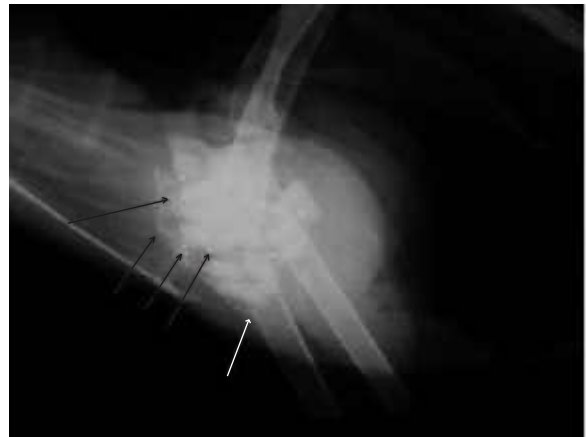
Fig. 2. Eend: latero-laterale opname van het abdomen; detailbeeld van de spiermaag. Ondanks erge superpositie van de spiermaag met het skelet is het grit duidelijk zichtbaar in de spiermaag. Ook zijn er enkele partikels met metaalopaciteit aanwezig.