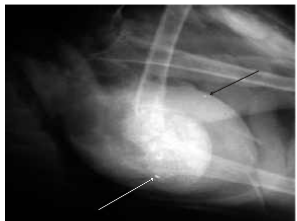
Fig. 3. Zwaan: Latero-laterale opname van het abdomen. Caudaal in het abdomen is de grote schaduw van de spiermaag zichtbaar. Deze bevat naast het normale grit ook verschillende partikels met hoge opaciteit.