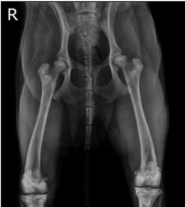
Figuur 1. Ventro-dorsale opname van de heupen van de golden retriever op de leeftijd van elf maanden, waarop volgende milde afwijkingen reeds zichtbaar zijn: zones met een verminderde opaciteit in beide femurhalzen, “slipping” van de femurkop ten opzichte van de femurhals rechts en bilaterale spieratrofie.