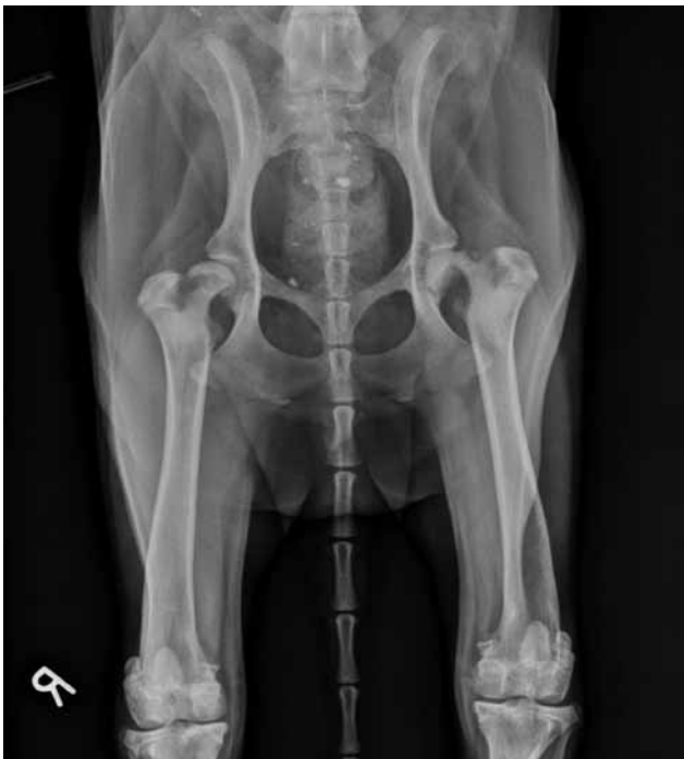
Figuur 2. Ventro-dorsale radiografie van de heupen op een leeftijd van dertien maanden. Volgende afwijkingen zijn zichtbaar: links is er een fractuur ter hoogte van de proximale, femorale groeiplaat en een heterogeen aspect van de femurhals met gedeeltelijke botresorptie. De rechterfemurkop is cranio-lateraal verplaatst ten opzichte van het acetabulum en de femurhals is op zijn beurt craniaal verplaatst ten opzichte van de femurkop. Er is ook uitgesproken spieratrofie zichtbaar.

groeiplaat, of osteochondrose, wordt verondersteld een rol te spelen in de pathogenese (Olsson en Ekman, 2002).