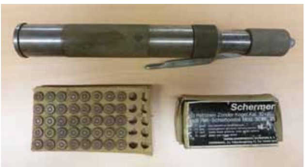
Figuur 4. 'Schermer' schiettoestel met patronen (Museumcollectie Diergeneeskundig Verleden Merelbeke, UGent).

delijk omwille van de praktische voordelen die het werken met een bewusteloos dier biedt, 'sloeg' men voorafgaand aan het eigenlijke doden. 'Slaan' was essentieel, althans bij ons en in de ons omringende West-Europese landen. In alle Germaanse talen vinden we dat woord terug in de bij het doden van dieren voor consumptie gebruikelijke terminologie: slachten, slachthuis, enz., afgeleid van 'slaan'. Denk ook aan het Franse abbatre en abattoir, afgeleid van bâton (knots, stok). In Engeland bleef de lokale, grotendeels Germaans sprekende, Angelsaksische boerenbevolking varkens, runderen en schapen slachten ('slay, slaughter'), maar ze waren in 1066 verslagen ('they were beaten') door de geromaniseerde Normandiërs, die wisten wat 'battre' was en die hun nieuwe onderdanen ook wel eens durfden trakteren op stokslagen (beats). Vanzelfsprekend werd ook het militaire jargon van deze heren aan het Frans ontleend: 'battle' van 'bataille', 'battle field', enz., allemaal termen die teruggaan op de primitieve knots.