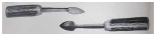
Figuur 6. ‘Kollesteek’ (uit: ‘Moderne beenhouwerij en charcuterie’, 1965).