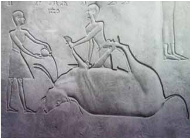
Figuur 7. Het slachten van een os als offer. Sarcofaag van prinses Ashwit, Thebe, elfde Dynastie (2134 – 1976 vr Christus).

De term humaan is hoe dan ook antropocentrisch: niet wat het dier ondergaat primeert, maar wat de mens ervaart. Toch wordt de uitdrukking humaan slachten soms gebruikt, wellicht omdat ‘diervriendelijk slachten’ een contradictio in terminis lijkt.