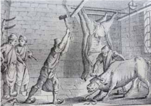
Figuur 1. Prent van Moreau le jeune (1765, detail).