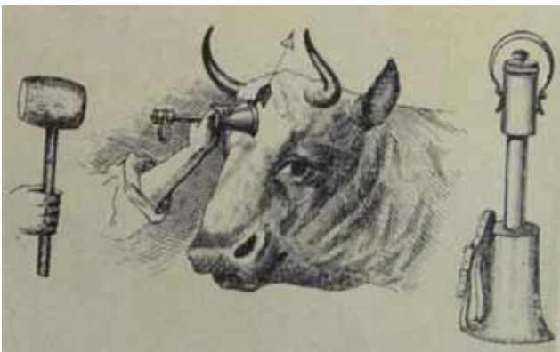
Figuur 2. Illustratie uit Rühl, J. (1914). Notice sur l'abattoir de Bruxelles. Exposé sur quelques réformes en matière d'abattage. In: Nos Meilleurs Amis , jg. 22 nr. 6, p. 63. Dit was het tijdschrift van de Brusselse vereniging voor dierenbescherming die deze manier van 'slaan' propageerde.