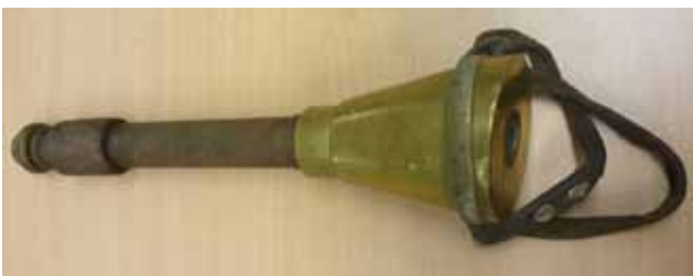
Figuur 3. Slagtoestel voor pen ingeslagen met hamer: zie Figuur 2 (Museumcollectie Diergeneeskundig Verleden Merelbeke, UGent).