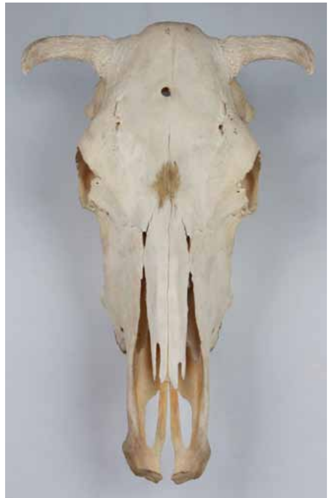
Figuur 5. Runderschedel met schietgat (MuMo, museumcollectie vakgroep Morfologie, Faculteit Diergeneeskunde, UGent, Merelbeke).

Bij het einde van dit tekstgedeelte moet nog iets gezegd worden over de uitdrukking ‘humaan slachten’ (humane slaughter). In het Engels is de term al meer dan een eeuw in gebruik, maar in het Nederlands is hij niet zomaar acceptabel. De term is dubieus. Duidt hij op een goedaardige, of minstens niet-wreedaardige manier van handelen? In tegenstelling tot wat het woord suggereert, is dit allesbehalve een universeel kenmerk van de menselijke soort. Of duidt dit op manieren van slachten die de gevoelens van mensen ontzien? De stadsmens anno 2016 wil het allerbeste voor zijn ‘pets’, maar wil niet geconfronteerd worden met het slachten, wil ook geen kadavers of karkassen zien, enkel netjes verpakte lapjes en hamburgers of onherkenbaar verwerkt vlees in klaargemaakte hapjes (12).