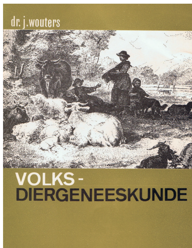
Figuur 1. Voorplat van het boekje van Wouters (1966).

De aandoeningen worden hierna kort besproken, waar mogelijk per diersoort met telkens één of meerdere van de belangrijkste toegepaste middelen als voorbeeld. Hier en daar wordt door de eerste auteur van dit artikel een aanvulling gegeven uit het