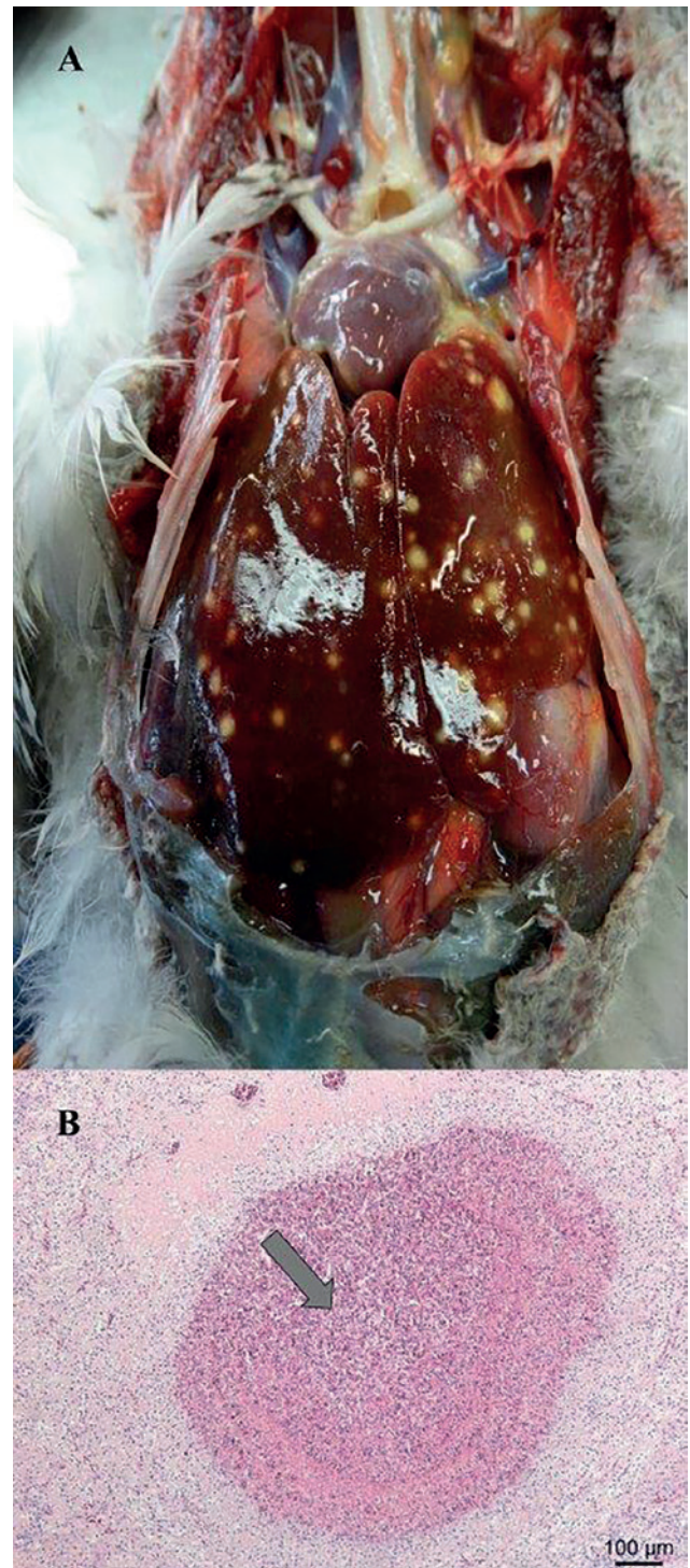
Figuur 2A. Multifocale, granulomateuze letsels in de lever. B. Histologische afbeelding (HE-kleuring) van de lever gekarakteriseerd door de aanwezigheid van een granuloom (pijl) met accumulatie van fibrinonecrotisch materiaal met rondom gedegenerende heterofielen, macrofagen en lymfocyten.

Na veertien dagen behandeling bleek de conjunctivaalzak echter opnieuw gevuld met een kazige substantie. Onder gasanesthesie (isofluraan + zuurstof) werd vervolgens een biopsie genomen van de massa en van de conjunctiva voor verder histologisch onderzoek. Intraoperatief werd eveneens zoveel mogelijk etter weg gecuretteerd. Het histologisch onderzoek (hematoxyline en eosine (HE)-kleuring) van dit biopsie toonde necrotisch weefsel aan met een uitgesproken infiltratie van heterofielen en lymfocyten. Gramkleuring toonde enkel groepjes staafvormige gramnegatieve bacteriën aan. De periodic acid-schiff (PAS)-kleuring was negatief voor schimmelhyfen. De algemene toestand van het vrouwelijke dier ging achteruit, gekenmerkt door lethargie en milde diarree. Enkele dagen later is het dier gestorven. Bij autopsie bleek de eend cachectisch (LG 595 g). De conjunctiva van het linkeroog was gezwollen en op de mucosa van het ooglid was een kazig/necrotisch beleg aanwezig. De linker infraorbitaal sinus was ook gevuld met die substantie. De dunne darm was gevuld met gas en vertoonde vaatinjecties. Het laatste deel van de dunne darm was sterk hemorragisch en necrotisch. De darmlussen waren onderling verkleefd. De longen waren gestuwd en oedemateus. Er was ook één granuloom aanwezig in de longen. De luchtzakken waren troebel en bevatten fibrineus exsudaat. Op de lever