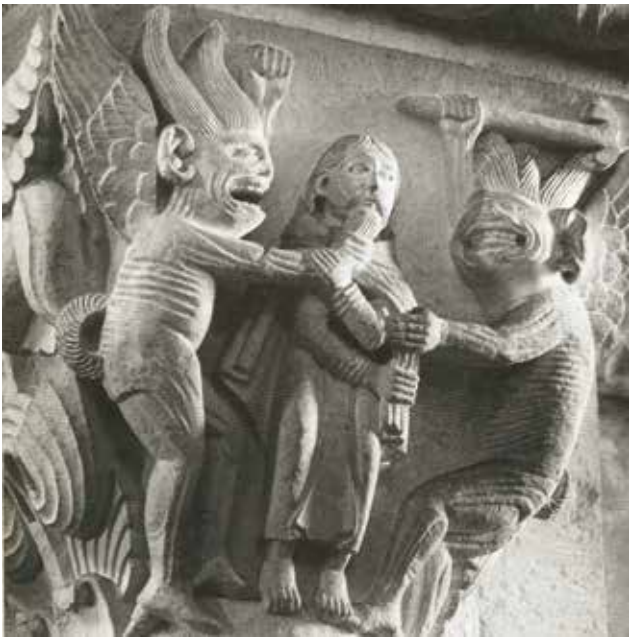
Figuur 1. Twee angstaanjagende creaturen, letterlijk kwelduivels, gaan de arme Antonius te lijf. Een van de fabelachtige kapitelen in de Maria Magdalenabasiliek van Vézelay (Bourgogne, eerste helft twaalfde eeuw).