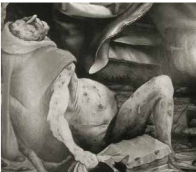
Figuur 10. Zieke lijdend aan het sint-antoniusvuur, vermoedelijk hier geen moederkorenvergiftiging maar bacteriële infectie, actueel meestal erysipelas genoemd (detail uit het Isenheimer altaar van Matthias Grünewald; cf. Figuur 3).

een manier om sterke afkeer en absolute verwerping uit te drukken.