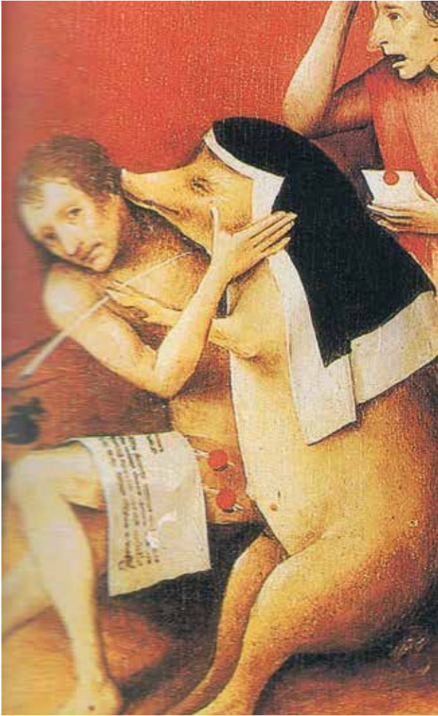
Figuur 5. Een als non verkleed varken poogt een naakte man te overhalen zijn testament te wijzigen ten gunste van haar of haar klooster (Jeroen Bosch, detail uit de ‘Tuin der Lusten’, Madrid).