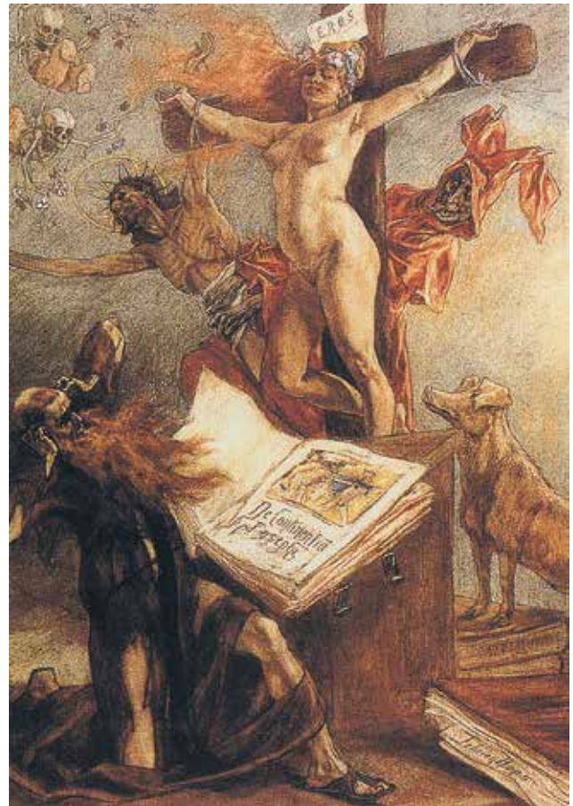
Figuur 7. Félicien Rops toont 'de bekoring' op de zo mogelijk meest schokkende manier: een voluptueuze naakte vrouw stoot Christus van zijn kruis terwijl Antonius zich vol afschrik afwendt van wat zich pal voor hem afspeelt. Boven op het kruis is het opschrift INRI vervangen door EROS. Er achter een duivel vermomd als monnik, maar met nauwelijks verhulde horens in zijn kap. Een varken kijkt genoeglijk toe.