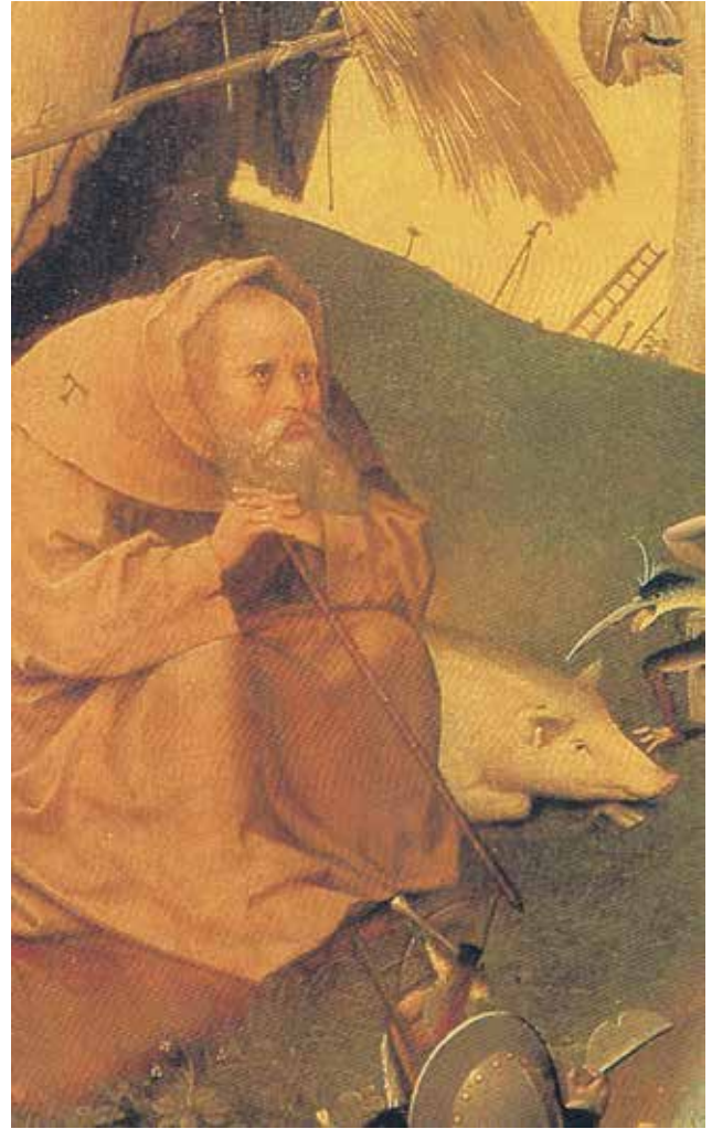
Figuur 6. Sint-Antonius omringd door allerlei fantastische, afschrikwekkende beesten en beestjes in de versie van Jeroen Bosch. Zijn varken heeft daar part noch deel aan (detail uit het Antonius-drieluik in Lissabon).

Nog een tweede mogelijke reden voor de slechte reputatie van varkens is dat ze wild kunnen te keer gaan. In een heel bekende episode uit het leven van Jezus van Nazareth ziet men hoe een bezetene miraculeus van zijn demonen verlost wordt: ze worden uitgedreven en zoeken hun toevlucht in een kudde varkens, die zich meteen beginnen te misdragen alsof