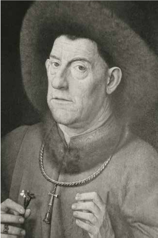
Figuur 9. Anoniem portret bekend als ‘De man met de Anjer’ (Berlijn). Hoogkwalitatieve en vermoedelijk getrouwe 16de-eeuwse kopie van een vroege Jan van Eyck, waarvan verder enkel een getekende versie uit 1429 bewaard bleef. Het streng (of is het wantrouwig?) kijkende personage, duidelijk ‘een heer van stand’, is herkenbaar als antoniet aan het tau (T) teken en het belletje.