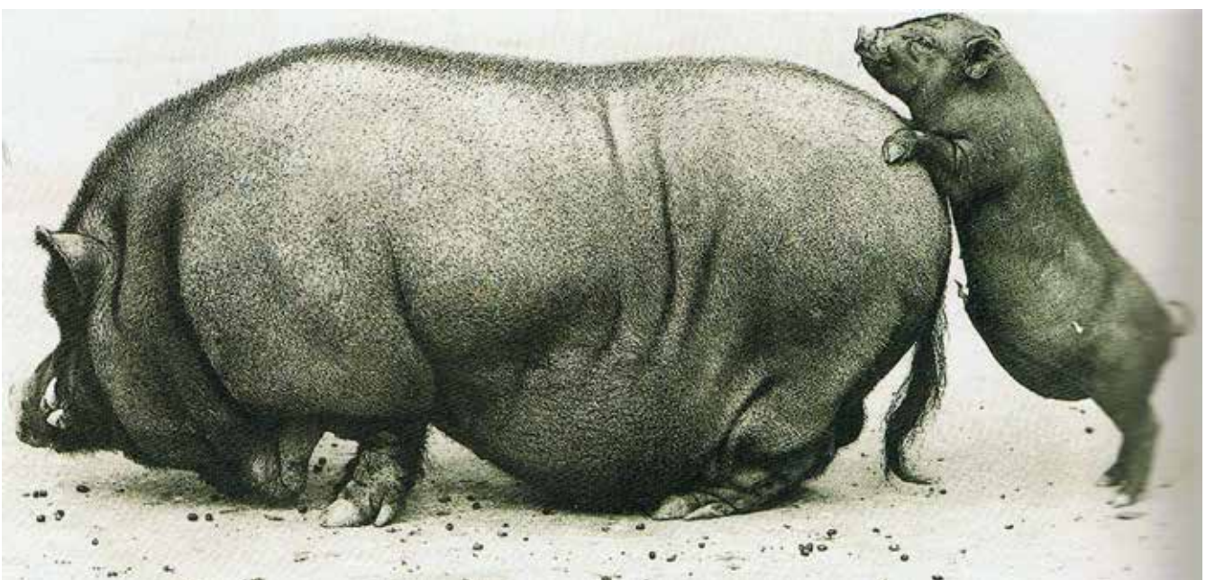
Figuur 8. Mini- en maxivarkens, hier in quasi karikaturale vorm. Het beertje is duidelijk opgewonden door de geurstoffen van het bronstige vette monster dat voor hem door de achterpoten zakt. Maar of het zal lukken? Bemerkt het spiraalvormige penisuiteinde (Uit Fokkinga, 2004).