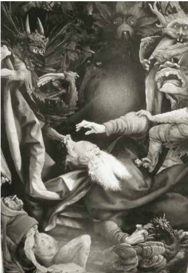
Figuur 2. Een deel van het beroemde altaar tussen 1510 en 1515 geschilderd door Matthias Grünewald voor het klooster van de antonieten in Isenheim (bij Colmar, Elzas) toont de bekoringen van Sint-Antonius door afschuwelijke monsters zoals alleen Grünewald die kon uitbeelden. Vier eeuwen na Vézelay was dit nog steeds de gebruikelijke manier van voorstellen.

ling voor de sint als Antonius ‘de Grote’, ‘van Egypte’, of ‘abt’ en ‘eremiet’ en wat ons betreft: vooral ‘met het varken(tje)’. Het is deze Antonius die ‘aanroepen’ werd - te hulp geroepen - ter bescherming en genezing voor aandoeningen die gekenmerkt zijn door sterk uitgesproken ontsteking, in middeleeuwse termen ‘vurige ziekten’.