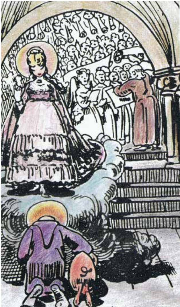
Figuur 13. Liefdevol naar de hemel geleid door Sint-Antonius wordt het beestje verwelkomd door Onze-Lieve-Vrouw. In de achtergrond dirigeert Sint-Petrus met zijn hemelsleutel een welkomsthymne. Werkje van Wilhelm Busch (1832-1908).