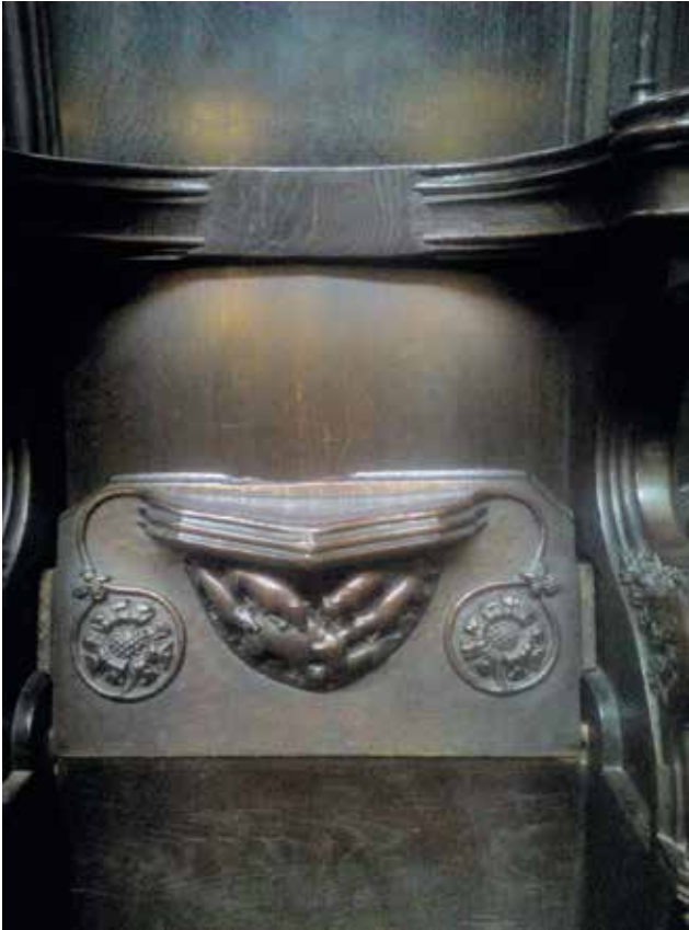
Figuur 14. Biggetjes onder een ‘misericorde’: een half-zitje dat de monniken hielp overeind te blijven tijdens de urenlang durende diensten. In middeleeuwse abdijkerken waren die plankjes dikwijls voorzien van steuntjes met fraai gesneden ‘drolerieën’ of bijbelse tafereeltjes. Hier een exemplaar uit de kathedraal van Chester (Verenigd Koninkrijk), in oorsprong een abdijkerk.

grote heilige. De combinatie is dus niet zo maar grautuit legendarisch, maar economisch en cultuurhistorisch gegrond, bovendien ook medisch-veterinair. Het was de opvallende, maar oppervlakkige gelijkens tussen een destijds belangrijke aandoening bij mensen en een tot in de vorige eeuw veel voorkomende ziekte bij varkens die, onder meer de orde van de antonieten ertoe bracht Antonius te propageren als bescherm- en geneesheilige voor mensen en dieren, vooral varkens.