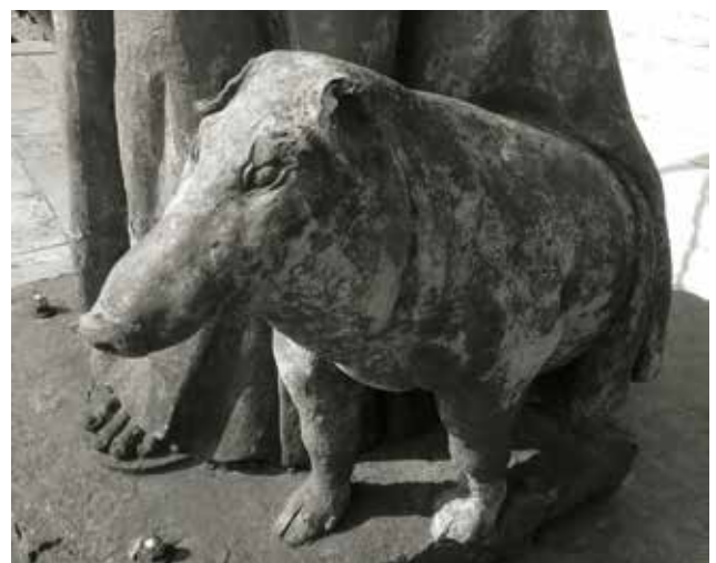
Figuur 4. Het varken naast de heilige kon best groot zijn, zoals bij dit Gentse beeld in de Sint-Antoniushof bij de Sint-Antoniuskaai, maar het oogt steeds onschuldig. Merk de spitse vorm van zijn belangrijkste werkinstrument: de snuit, ideaal om te wroeten. De huidige korte varkenssnuit met abrupt oplopend voorhoofd is het resultaat van latere kruisingen en selectie (Foto 2018).